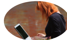
Authentification & péage